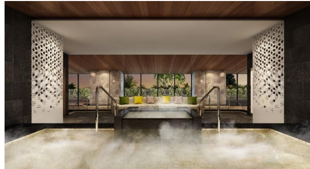
スタイリッシュな温泉大浴場

箱根強羅のスピリッツと変わらぬ自然の魅力を凝縮したホテルインディゴ箱根強羅では、あらゆる場面で心に残る感動体験に出逢えます。一歩足を踏み入れると、コンテンポラリーなスタイルと和の伝統が融合した世界が目の前に現れます。「火」をテーマにしたオールデイダイニングレストランや、箱根の清流をイメージした「水」がテーマのバーラウンジでは、その土地ならではの素材にインスパイアされた、こころ躍る美食の世界を。お気に入りの水着で楽しむスタイリッシュな温泉大浴場(男女共用)に入り、ミネラルたっぷりの温泉ヒーリングでこころも身体もポカポカに。スパトリートメントやフィットネスセンターなどの施設も充実しています。