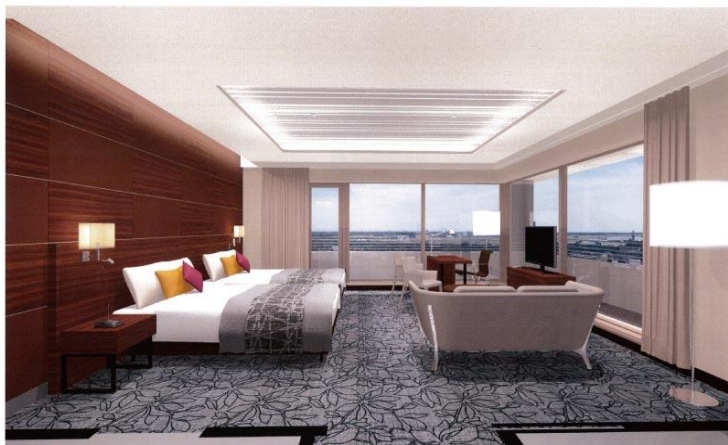
クラウンプラザホテル千歳 F-41

写真は完成時のホテル全景と 57.3 m 2 のデラックスコーナーツインのイメージです。