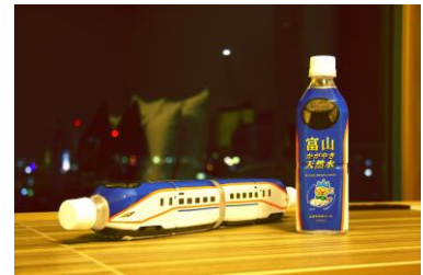
「富山かがやき天然水」イメージ

ホームページにてご予約受付中 www.anacrowneplaza-toyama.jp