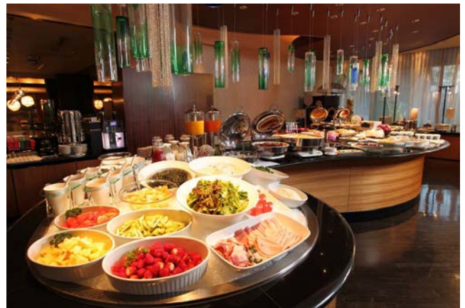
グローバルスタンダードの朝食ブッフェ(イメージ)