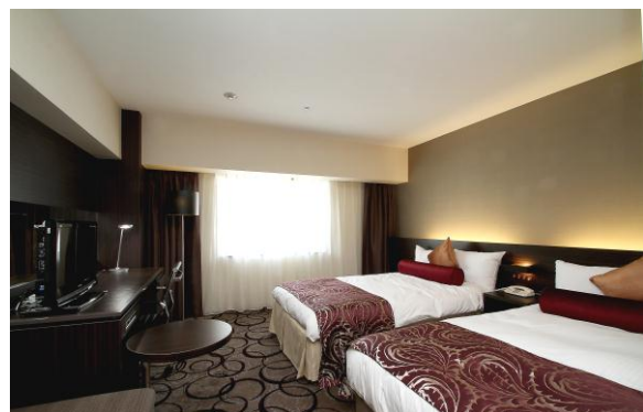
スタンダードツイン（イメージ）