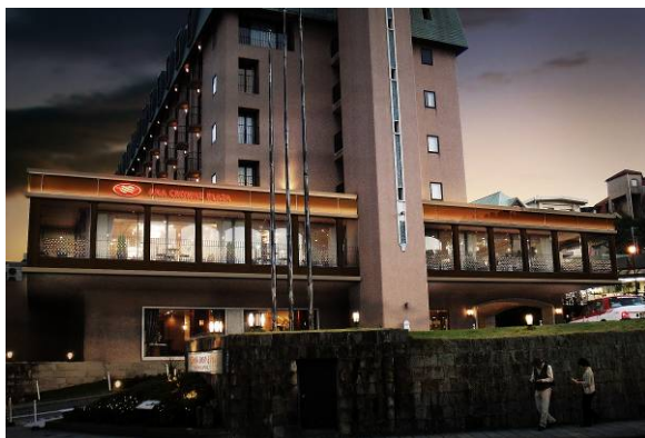
ANA クラウンプラザホテル長崎グラバーヒル 外観(イメージ図)