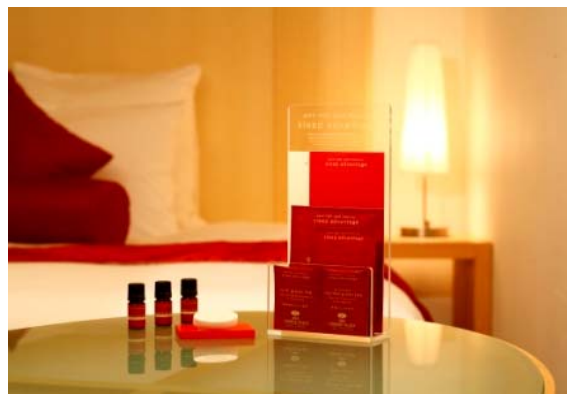
ANA クラウンプラザホテル オリジナル快眠プログラム「Sleep Advantage」