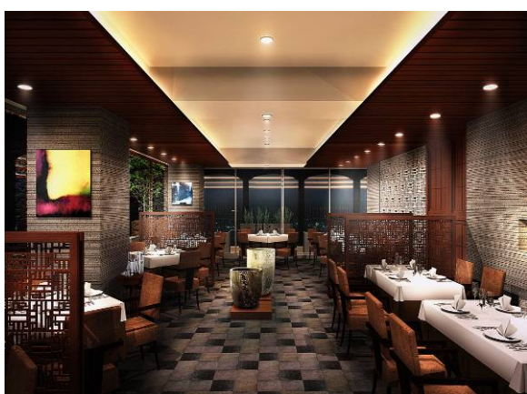
ダイニング ラ・ベルヴュー(イメージ図)