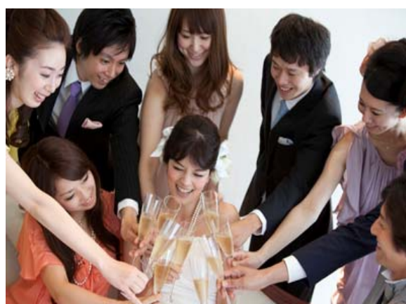
ANA クラウンプラザ・ウェディング オリジナルサービス(チャットコーナー)