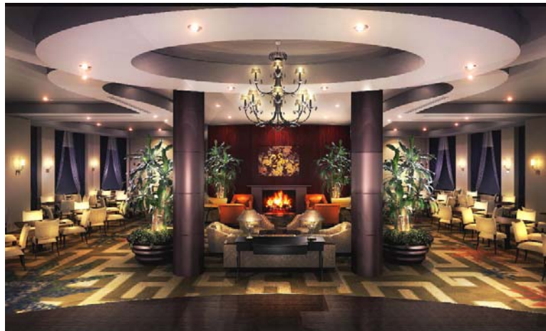
スターゲイト(イメージ図)

最上階のスターゲイトに到着すると、目の前には、眺望が広がり、足元に「GRAND GATE TREE」の梢をイメージした空間が開けます。