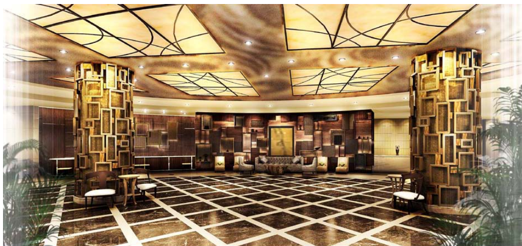
1Fメインロビー(イメージ図)

ロビー中央の2本の柱を、一対のシンボルツリーに見立てた「GRAND GATE TREE」が、ゲストをお迎えします。