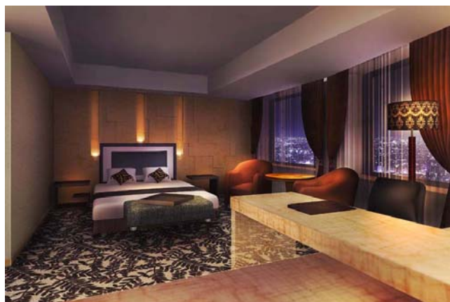
エグゼクティブダブルルーム(イメージ図)

シンプルモダンをベースに、モチーフやカラーをプラスした、新しいくつろぎの空間を展開します。クラウンプラザのグローバルスタンダードに基づき、客室の仕様の変更も行います。