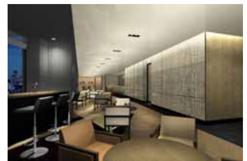
窓際にハイテーブルを配したバーエリア (イメージ) 奥がダイニングエリアとなっている。