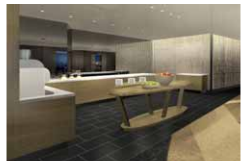
ダイニングエリア内の ブッフェコーナー (イメージ)