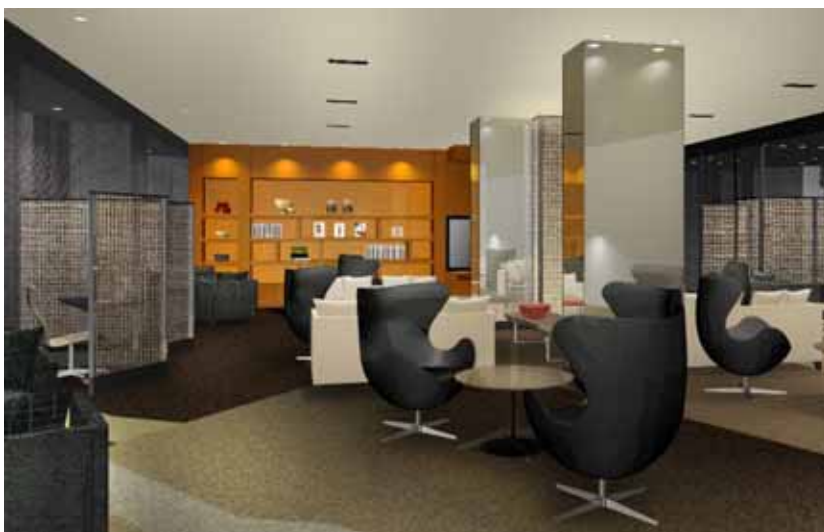
クラブラウンジ内のライブラリーエリア (イメージ) モダン感覚であっても、居住性に富んでいる。